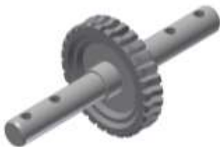
TENGELYES CSIGAKERÉK forgácsolás, bronzkerék fogazás, edzés, köszörülés