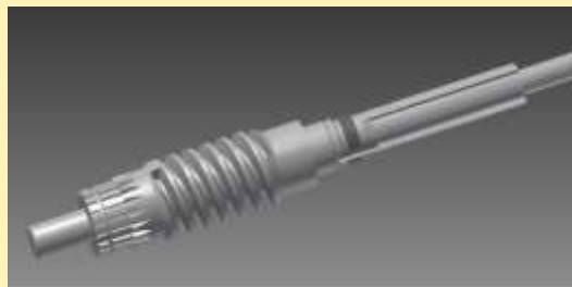
CSIGATENGELY GYÁRTÁS esztergálás, örvénylő menetvágás, bordamarás, hőkezelés, köszörülés