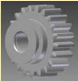
FOGASKERÉK esztergálás, fogazás hőkezelés, köszörülés