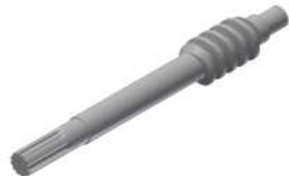
CSIGATENGELY forgácsolás, menethengerlés, bordamarás, edzés, köszörülés