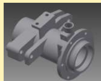
TENGELYTÖLCSÉR öntvény esztergálás, marás, karimák felfúrása