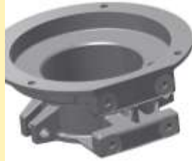
ÖNTVÉNY KÖZDARAB megmunkálás CNC megmunkáló központtal